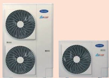
Venkovní jednotky 38AW