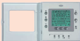
Programovatelný termostat řady Comfort™